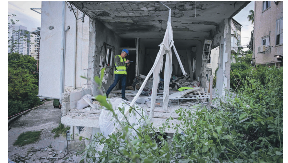
כל הארץ הפכה לחזית טילים ויירוטים. חזית נפילה ברמת גן השבוע.

מהטילים באוויר ועד התובנה שעל הקרקע: המלחמה מוחקת פערים ומחדדת מסקנות