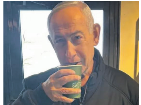
הקפה היה ערב לחכו של נתניהו, אך חמצמץ מאד לשמאל ולר"ב. מתוך הסרטון אותו ראו השבוע עשרות מיליונים ברחבי תבל

הסרטון נגד הפייק האיראני: בעולם התלהבו מההסברה, בארץ שאלו על החשבונית