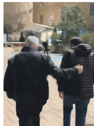
העוזר הבכיר חזר ללשכה ועמו סרטוני הבחירות. אורח (מימין) מתקבל ע"י נתניהו