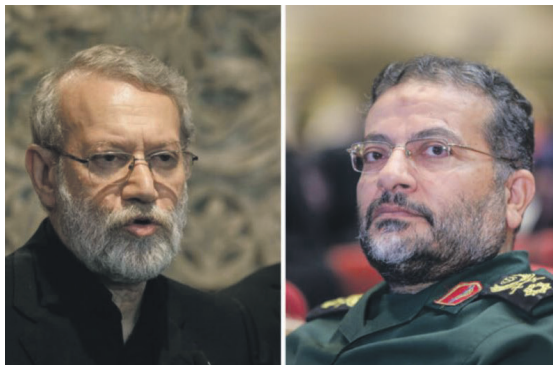
אווירת חשדנות במשמורת המהפכה, כולם חושדים בכולם. המחוסלים סלימאני מימין ולאריג'אני

והנה עתה, כאשר גם באל-ג'זירה מתקשים להסתיר